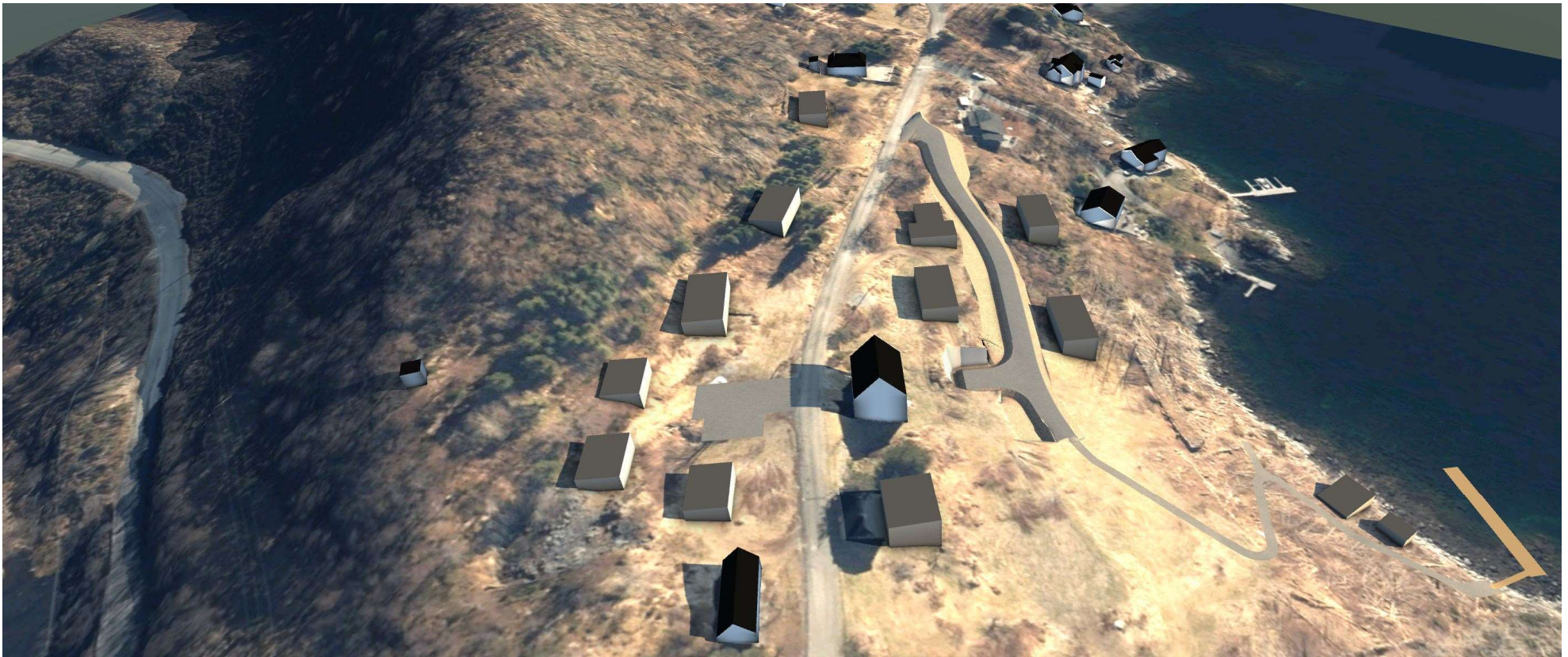
Planområdet sett frå nordvest. Ny bebyggelse innordnar seg eksisteradne bebyggelse.