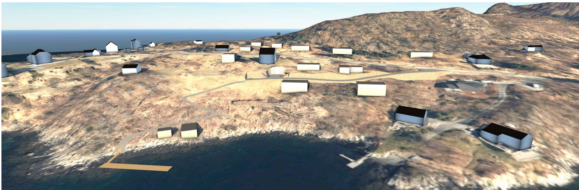
Planområdet sett frå sørvest.